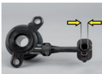
Fig. 3: LuK CSC 510 0098 10 Ligação hidráulica 11,7 mm