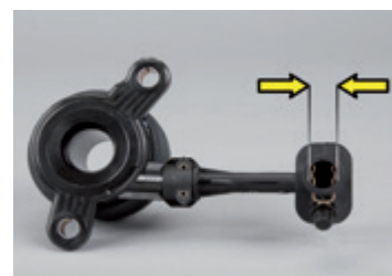
Fig. 2: LuK CSC 510 0097 10 Ligação hidráulica 13,3 mm