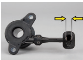
Fig. 1: LuK CSC 510 0090 10 Ligação hidráulica 12,2 mm