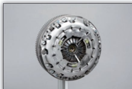
Fig. 9: Retire a chumaceira de centragem com a ajuda do parafuso.