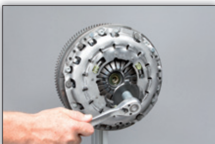
Fig. 8: Desenrosque e retire a peça de bloqueio com a ferramenta adequada. Daí em diante não será necessária.