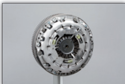
Fig. 7: Coloque o prato de pressão da embraiagem e os parafusos, e aperte com o binário de aperto recomendado pelo fabricante do veículo.