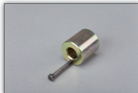
Fig. 3: Nos volantes bimassa, a chumaceira de centragem (400 0076 10) deve ser utilizada com o espigão guia.

Este documento serve unicamente como comparação. Devem ser sempre tidos em conta os números de substituição fabricante do veículo.