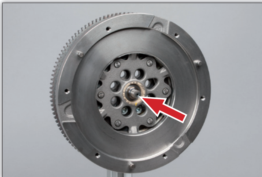
Fig. 1: Espigão guia do volante bimassa 415 0377 10

de artigo: 415 0377 10 (volante bimassa) 400 0076 10 (chumaceira de centragem)