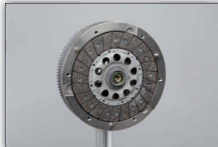
Fig. 6: Retire o parafuso da chumaceira de centragem.