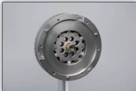
Fig. 4: Coloque a chumaceira de centragem antes de montar a embraiagem (preste atenção ao parafuso).