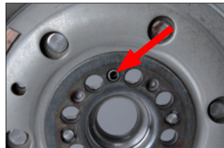
Fig. 2: Orifício de ajuste no volante bi-massa do lado da cambota

O volante bi-massa pode ser montado em várias posições apesar de só uma estar correcta.