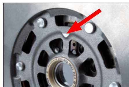
Fig. 3: Marcação do orifício de ajuste através de uma marca triangular no lado da caixa de velocidades do volante bi-massa

Durante a montagem, assegurar-se de que o pino de ajuste da cambota entra no orifício de ajuste situado no volante bi-massa e previsto para este efeito. O orifício de ajuste situado no volante bi-massa está assinalado por uma marca triangular no lado da caixa de velocidades do volante bi-massa.