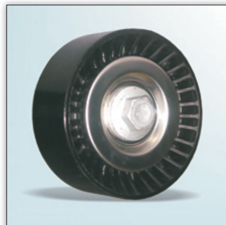
Fig. 2: Nova versão em plástico

No âmbito do desenvolvimento contínuo dos nossos produtos, foi modificada a superfície de rodagem da polia de inversão 532 0501 10 de metal para plástico. Durante a fase de modificação é possível que as polias de inversão sejam fornecidas tanto na versão de metal como na versão de plástico