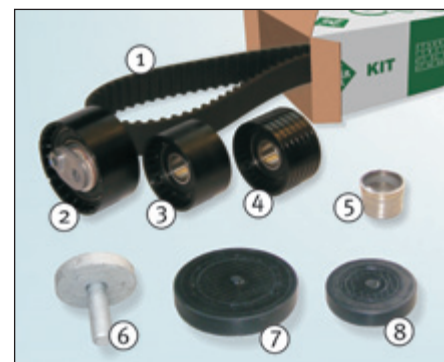
Fig. 2: Conteúdo do KIT 530 0342 10

Encontrará as peças de substituição correspondentes no nosso catálogo on-line em www.Schaeffler-Aftermarket.com.pt ou em www.RepXpert.com .