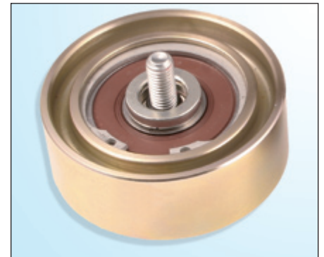
Fig. 2: 532 0294 10 (nova versão)

No âmbito do contínuo processo de desenvolvimento dos nossos produtos, modificámos a superfície do rolo fixo 532 0294 10 de material plástico para material metálico.