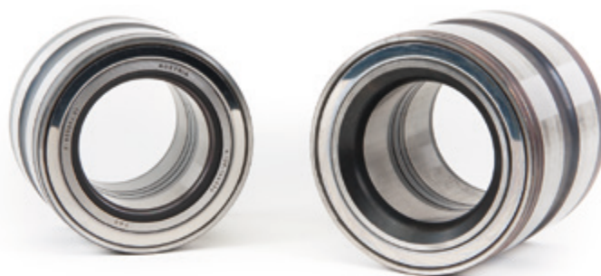
Fig 1: Truck Hub Unit com anel de vedação (esq.) ou redução das extremidades (dir.) no anel interior do rolamento

Para os rolamentos acima mencionados deve-se ter em conta o lado de montagem. Este é determinado pela forma da extremidade plana do eixo e do anel interno do rolamento da THU, tal deve ser esclarecido nesta informação de serviço para uma melhor compreensão.