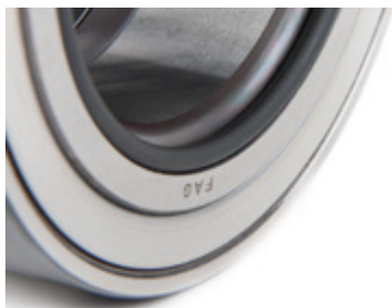
Fig 2: Truck Hub Unit com junta tórica

A diferença definitiva observa-se no anel interior do rolamento. Na parte interna de alguns rolamentos encontra-se uma junta tórica (Fig. 2), enquanto nos outros rolamentos observa-se neste ponto a chamada redução/curvatura das extremidades (Fig. 3). A tabela a seguir mostra a característica e a direção de montagem dos rolamentos.