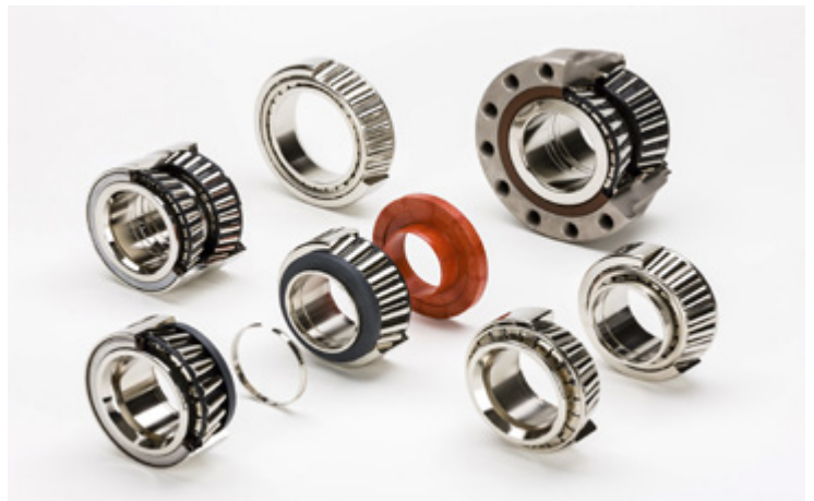
Figura 1: Programa de produtos FAG para veículos comerciais

Há já vários anos que a FAG disponibiliza soluções inovadoras de manutenção para rolamentos de roda. Com elas é possível oferecer ao cliente uma solução de manutenção de primeira qualidade e, ao mesmo tempo, económica.